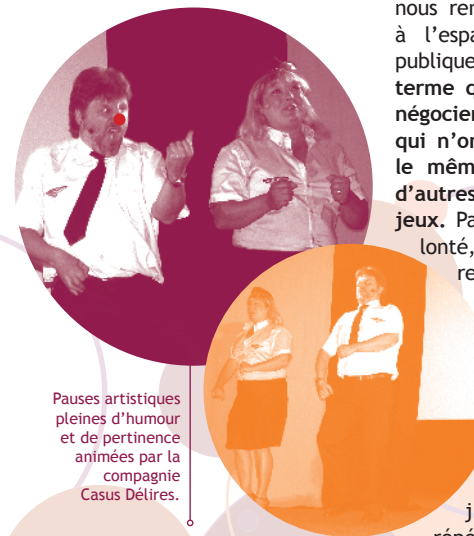
Pauses artistiques pleines d'humour et de pertinence animées par la compagnie Casus Délirés.

“ L'atout principal que je vois dans ce travail, c'est ce désir de faire autrement et de faire ensemble. Il est question d'ouverture, de décloisonnement... Cette envie de faire ensemble paraît tout à fait essentielle contre le découragement. Quittons envie, désir et restons à volonté qui nous renvoie à l'espace public, à l'espace de la négociation publique. C'est ça l'enjeu. Le terme qui vient ensuite, c'est négocier. Négocier avec ceux qui n'ont pas la même envie, le même désir, ceux qui ont d'autres intérêts, d'autres enjeux. Passer de l'envie à la volonté, cela veut dire négocier, reconnaître l'intérêt général du compromis avec ceux qui ne partagent pas les mêmes valeurs comme enjeu. Il n'est pas question ici de repli sur le territoire, d'enfermement identitaire. Et c'est là que j'ai un doute... Il y a une répétition du mot culture