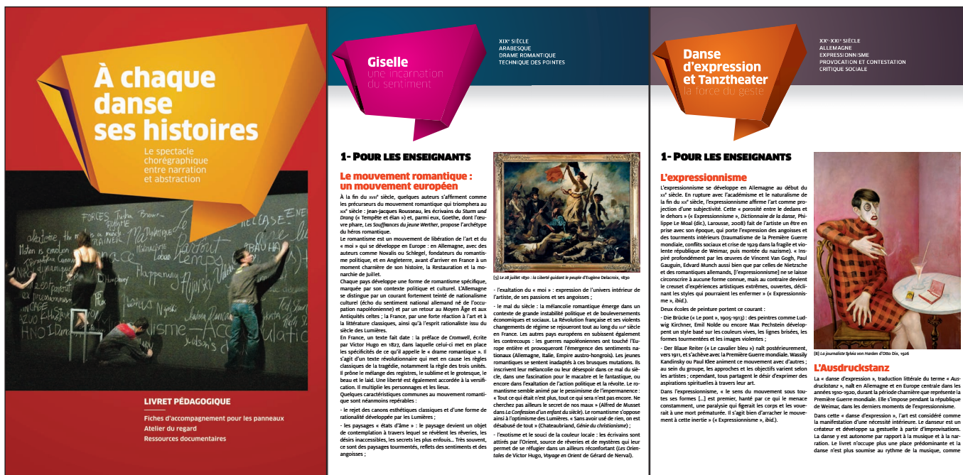
Couverture et pages extraites du livret pédagogique.