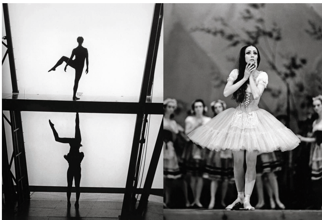
De gauche à droite : Petites pièces montées (1993) de Philippe Decouflé, Compagnie DCA, photo Jean-Marie Gourreau, 1994. Natalia Bessmertnova en Giselle dans la scène de la folie (fin du 1 er acte), Ballet du théâtre Bolchoï, photo Jean-Marie Gourreau, 1972.

Pour en savoir plus sur cette action : Centre national de la danse Formation et pédagogie / Éducation artistique et culturelle T 01 41 83 98 19 mediation.culturelle@cnd.fr