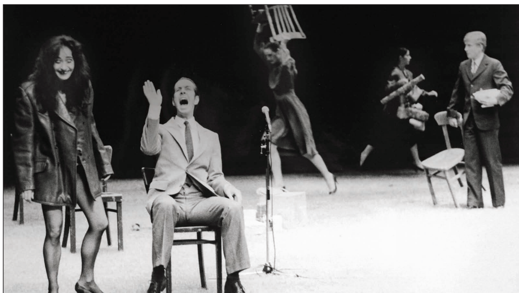
Photo issue du livret pédagogique. 1980 (1980) de Pina Bausch, Tanztheater Wuppertal